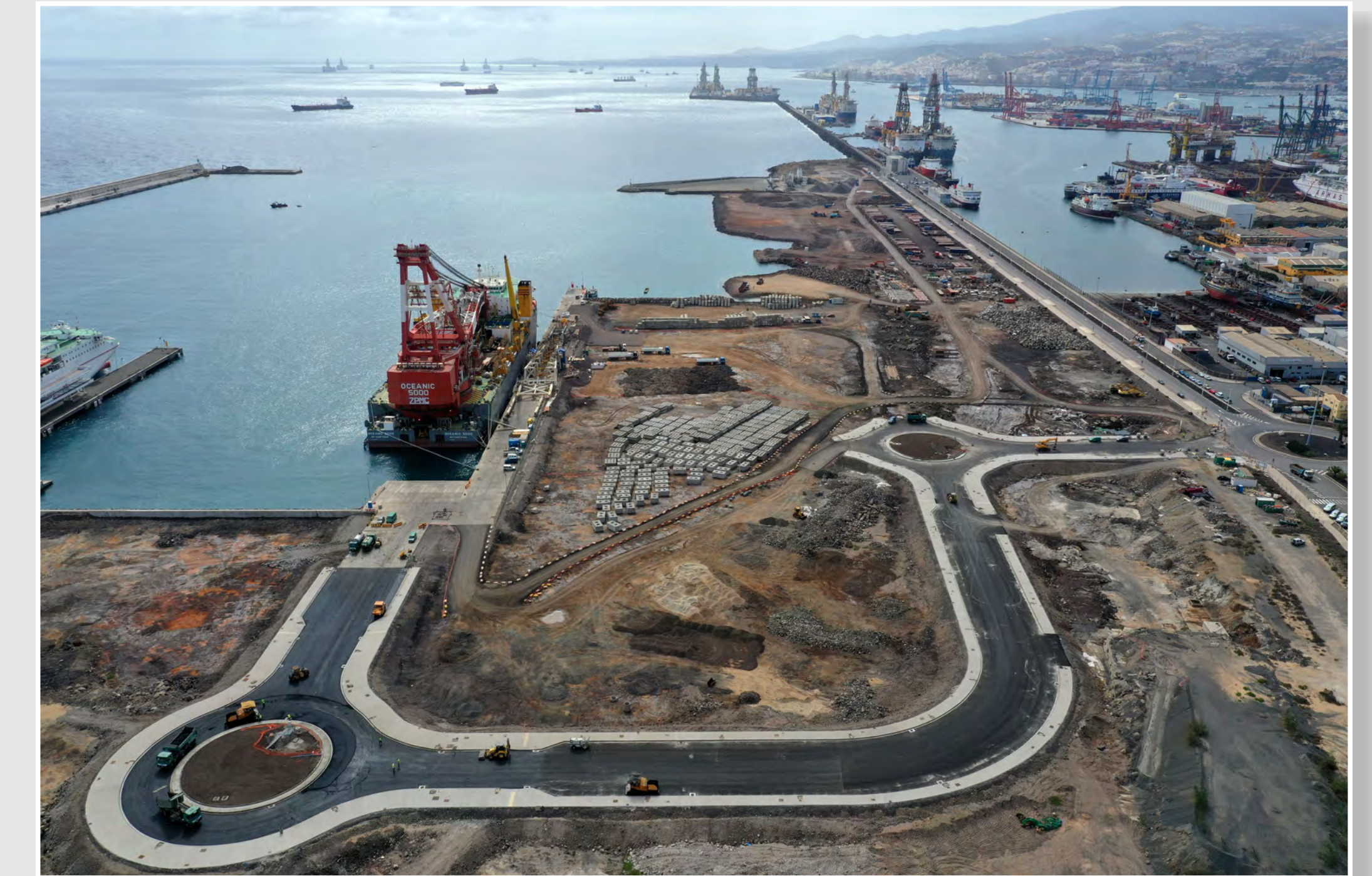
Estado Actual, Noviembre 2020