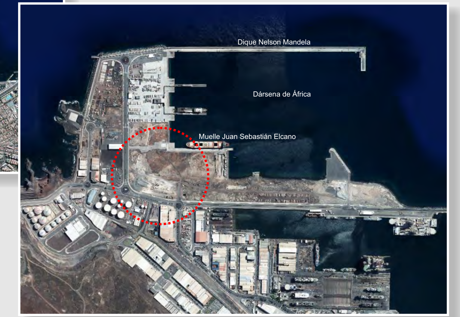
Dársena de África - Zona de Actuación