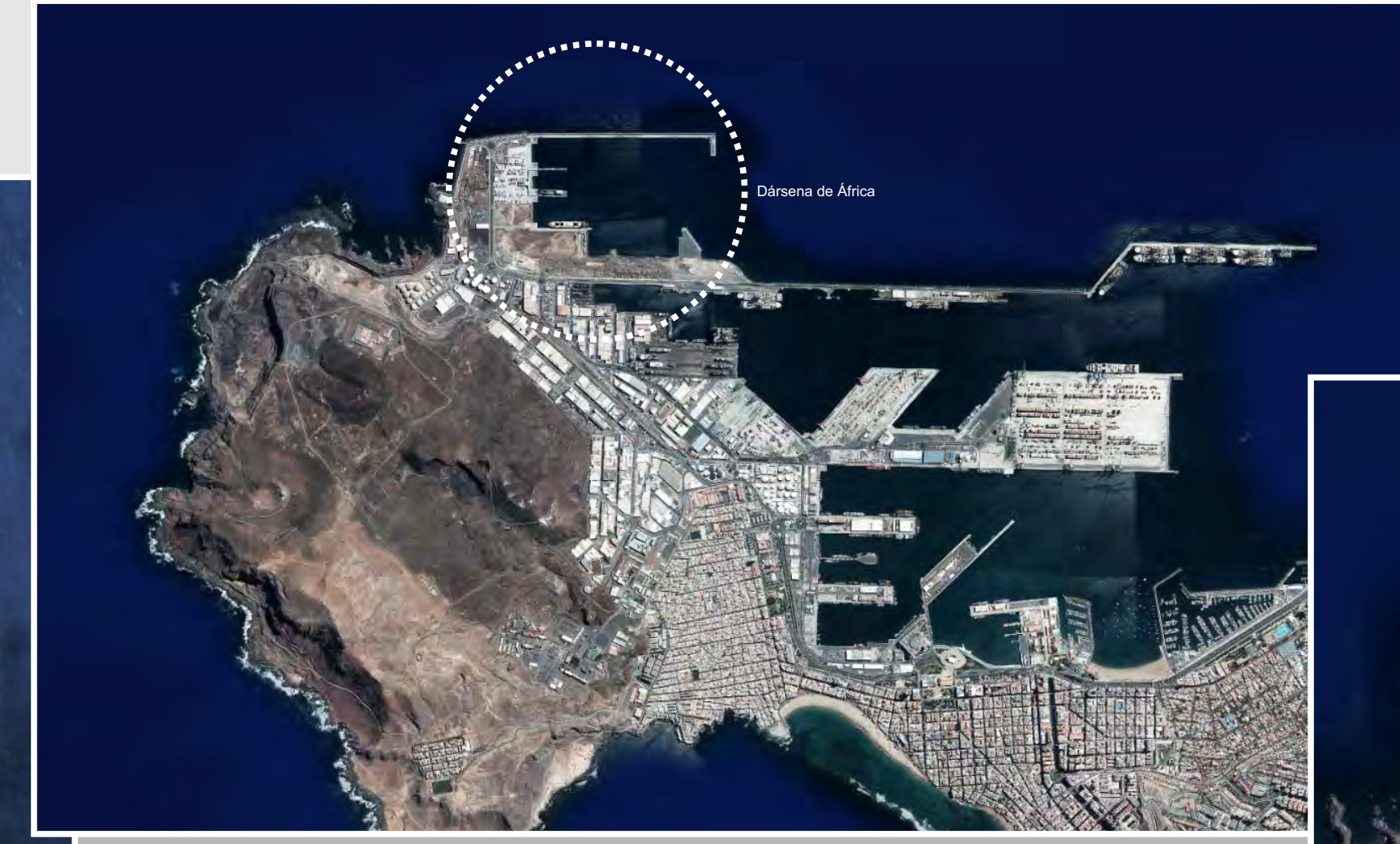
Puerto de Las Palmas- Emplazamiento