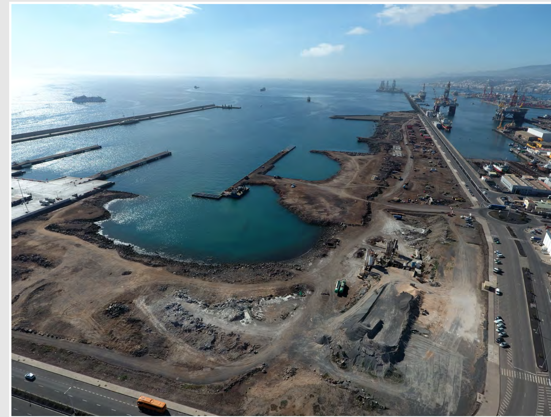
Estado Inicial, abril 2018