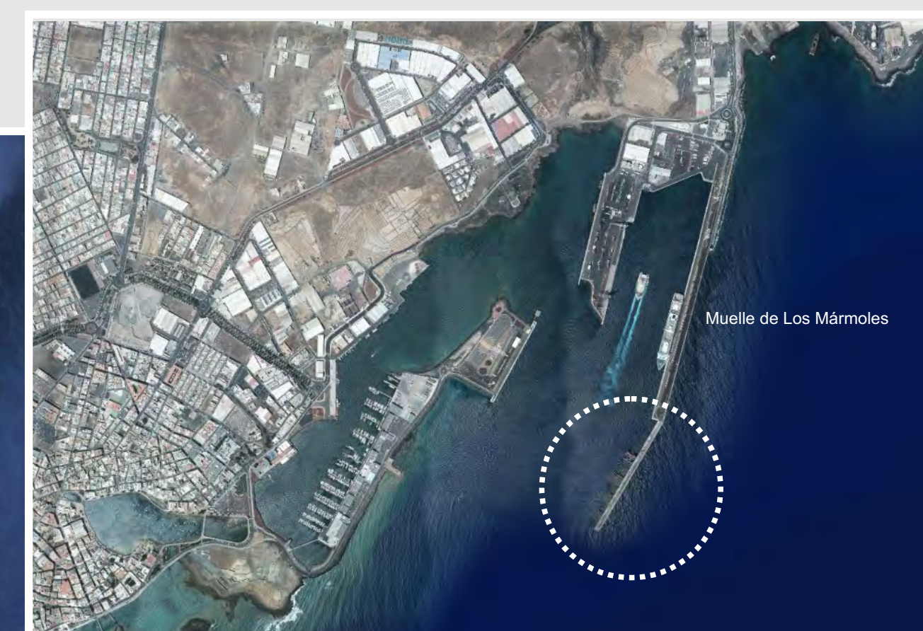
Puerto de Arrecife - Emplazamiento