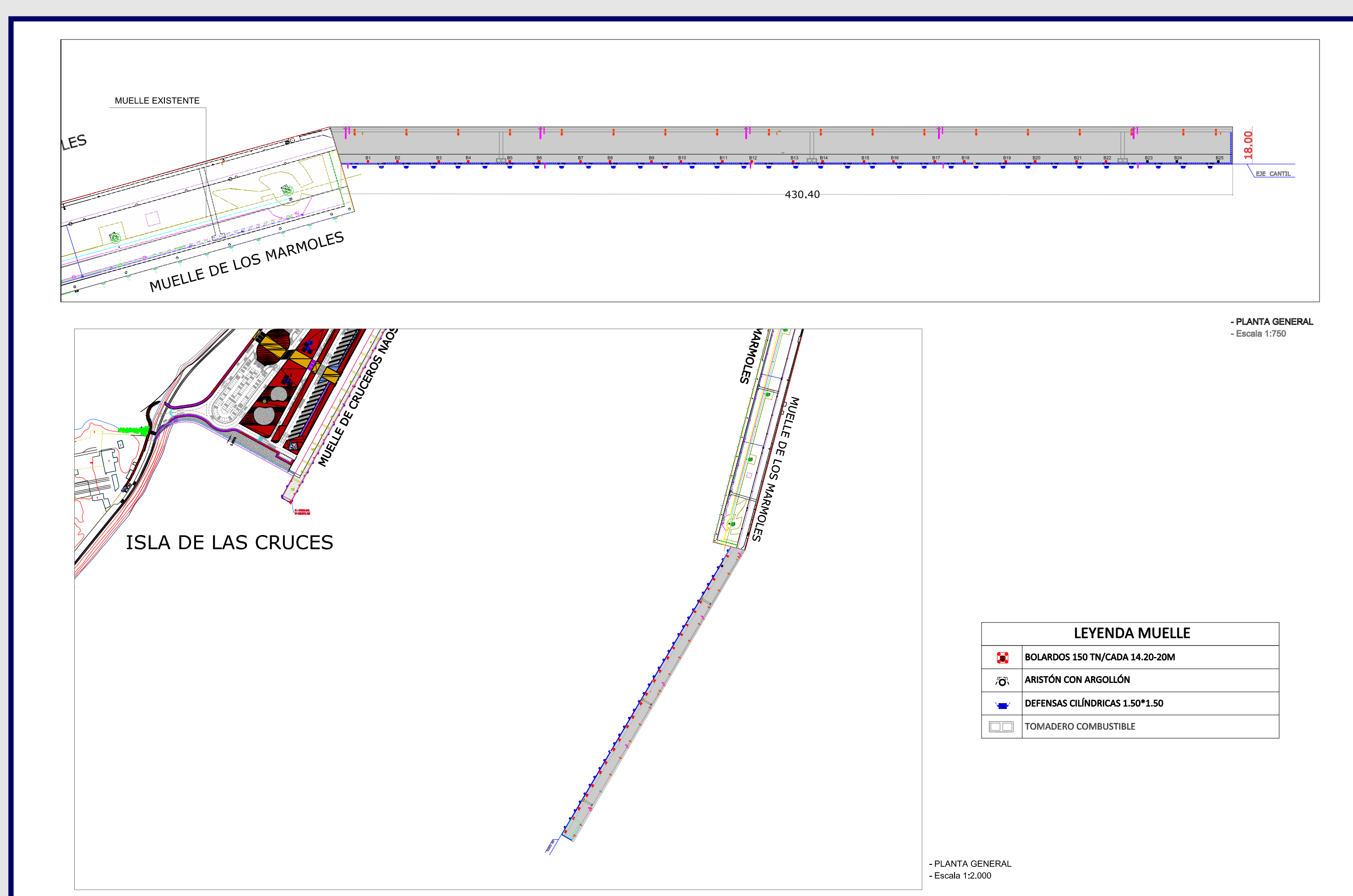
Planta General del proyecto