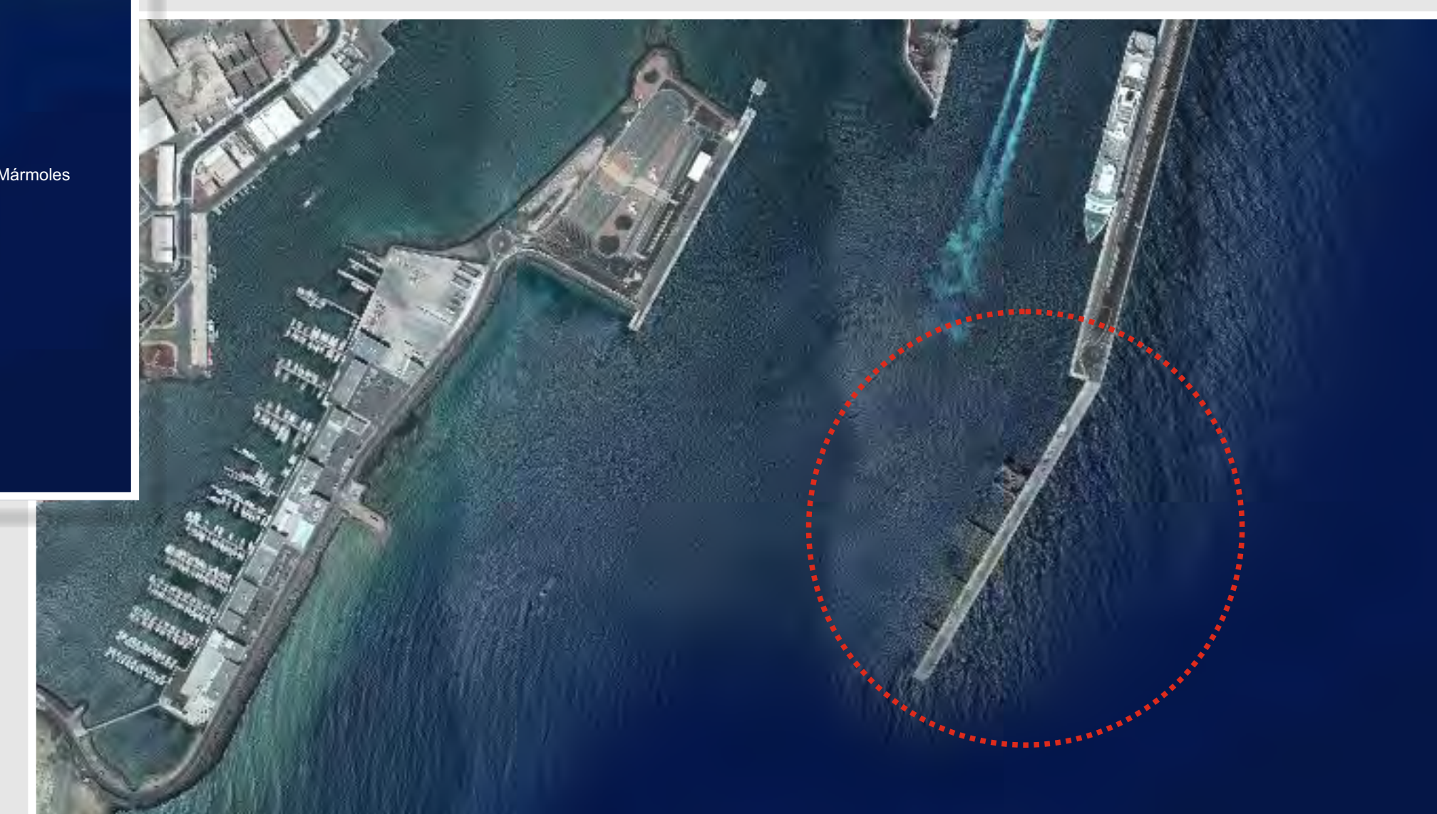
Muelle de Los Mármoles - Zona de Actuación