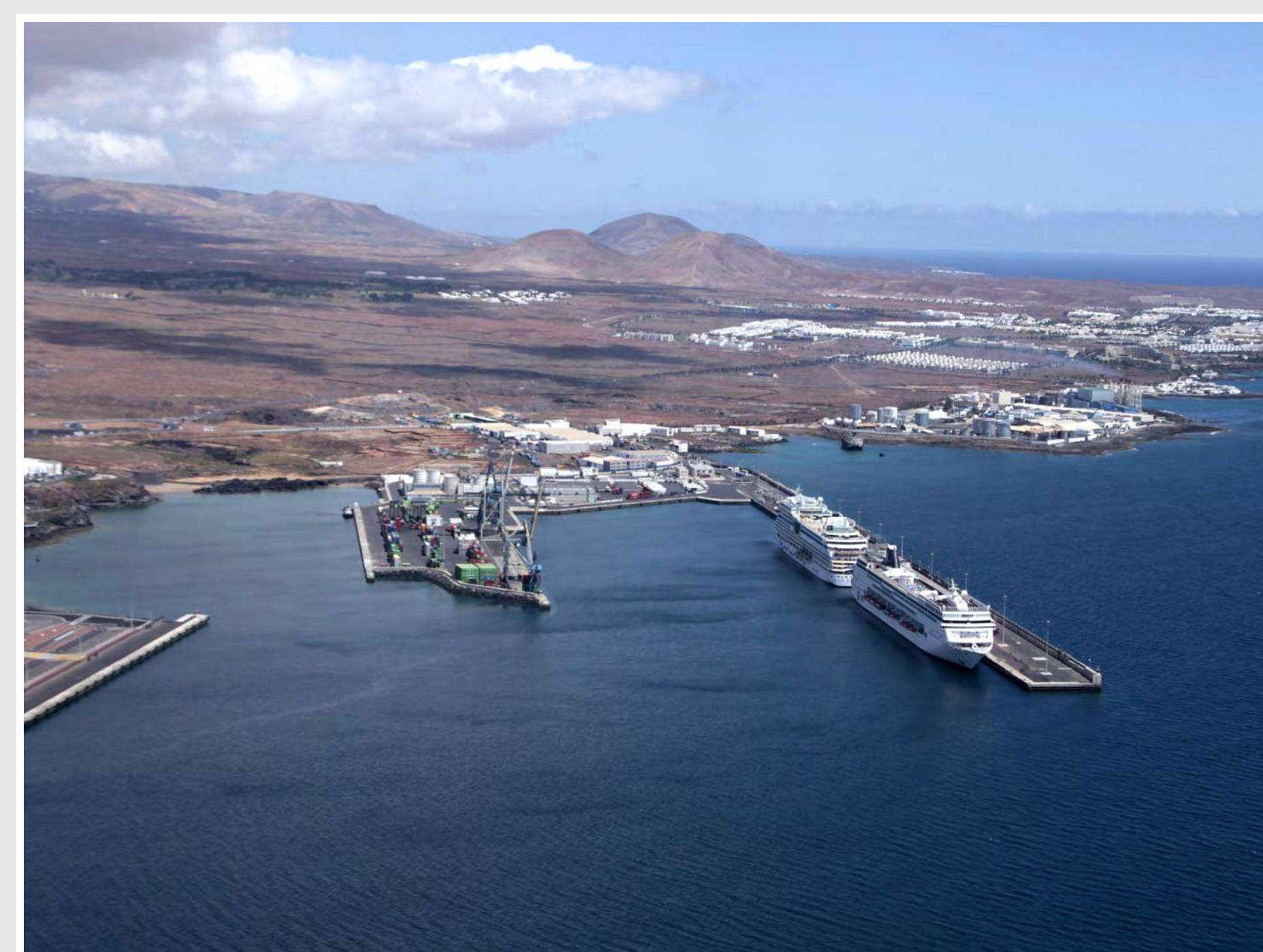
Estado Inicial, abril 2015